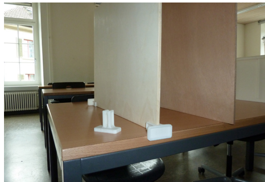
Kunststoffhalterung, hergestellt mit dem 3-D-Drucker

Dank grosszügiger Unterstützung durch die Geberit Productions AG hat das BWZ nun einen 3-D-Drucker.