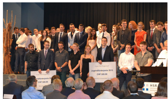
Die erfolgreichen Kandidatinnen und Kandidaten