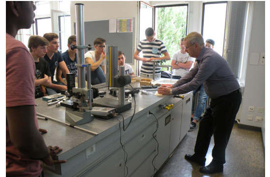
Messtechnikseminar Brütsch Rüegger AG

Wenige Berufsfachschulen werden bereits ab Sommer 2015 mit Pilotklassen starten; im Fachkundeunterricht gibt es für Lernende dann Tablets anstelle von Ordnern und Büchern.