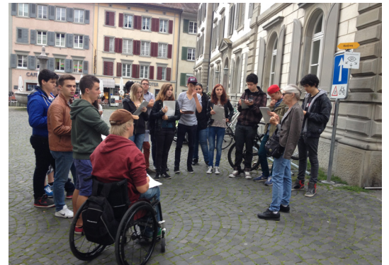
Klasse ZFA 14

Stadtführung: In der 3. Schulwoche haben alle neu eingetretenen Lernenden der Abteilung Gewerblich-Industrielle Berufe im Rahmen des Allgemeinbildenden Unterrichtes eine Stadtführung in Rapperswil unter kundiger Leitung erfahren dürfen. Dazu mussten sie viele Notizen schreiben und diese anschliessend im Unterricht an der Berufsfachschule verarbeiten. Dabei wurde die Rapperswiler Altstadt, die Turmbesteigung des Schlosses Rapperswil oder die Besichtigung des Bunkers sehr eindrücklich selber erlebt. Mit dieser Kurzexkursion haben die Lernenden bereits erste Leistungsziele in der Allgemeinbildung erreicht. Damit haben unsere Lernenden vom neuen, mehrjährigen Schulort einiges mehr gesehen als nur den Weg vom Bahnhof zum BWZ Rapperswil-Jona.