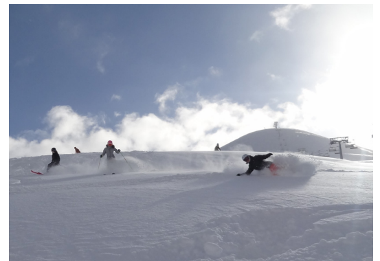
Geniessen die Abfahrt im Neuschnee