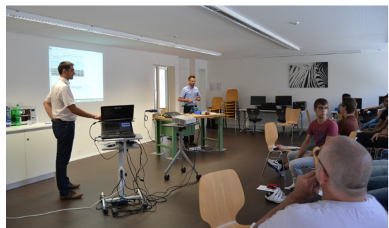
Fachseminar Bossard AG